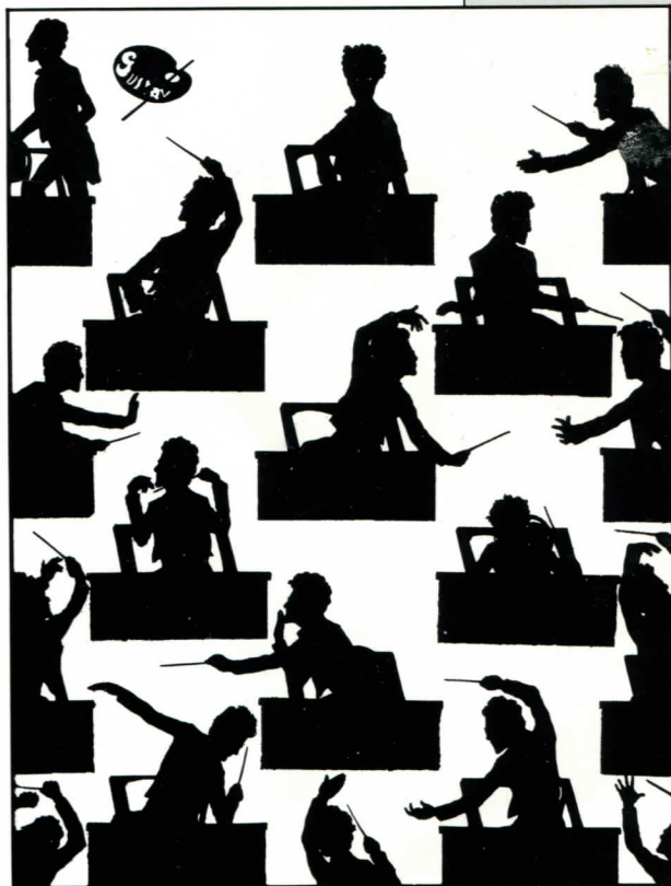
De dirigent Gustav Mahler. Naar tekeningen van dr. Otto Boehler.